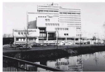
→ Bij de renovatie van Leeuwenburg wordt het oorspronkelijke ontwerp althans precies gevolgd.