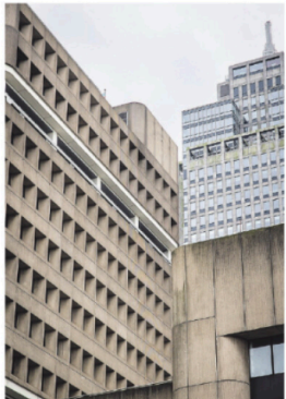
→ Alle gevelplaten worden vervangen.