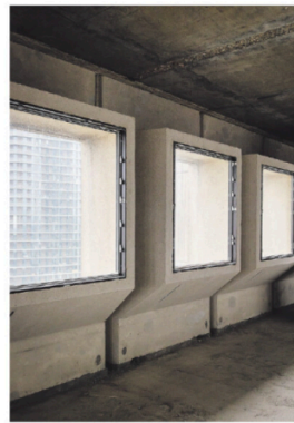
→ Onder: de Rijkspostspaarbank in 1979.