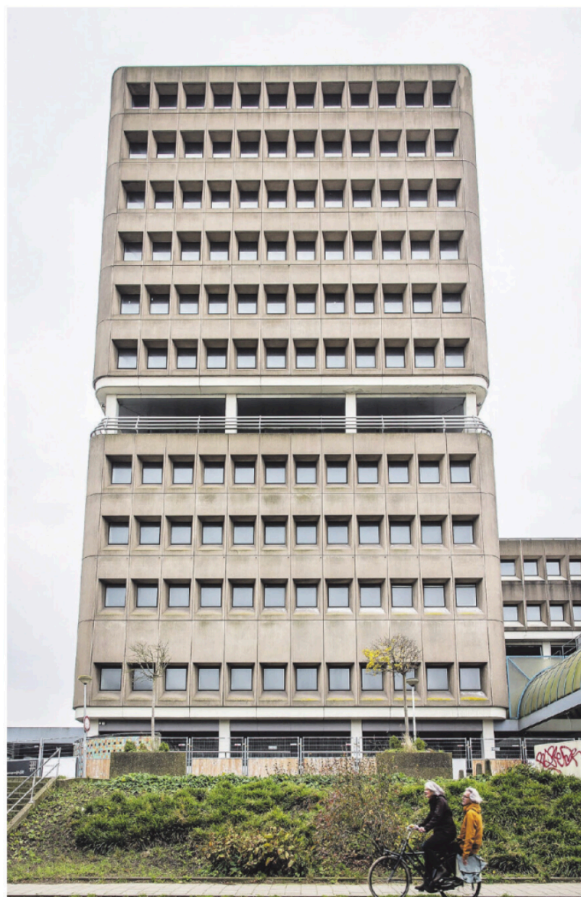
→ In de onderste verdiepingen moeten publiek toegankelijke voorzieningen komen, zoals een restaurant en een sportschool.

Pal naast het Amstelstation staat Leeuwenburg, een betonnen brutalist. Het zag ernaar uit dat het oude Rijkspostspaarbankgebouw tegen de vlakte zou gaan, maar de projectontwikkelaar besloot de kolos toch te renoveren. tekst Dylan van Eijkeren, foto's Dingena Mol